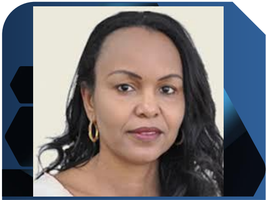
S.E Mme Fatima Haram ACYL Présidente d'honneur